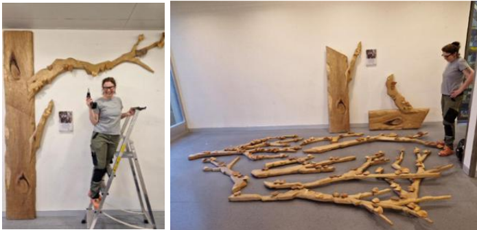
Sonja Bantli beim Demontieren sowie vor dem demontierten Baum.

Der Entscheid fiel zugunsten der Rückgabe an die Künstlerin. Sie freut sich darauf, ihn an einem neuen Ort aufzustellen, wo er weiterhin Menschen erfreuen wird. So bleibt das Kunstwerk erhalten und bekommt eine neue Heimat.